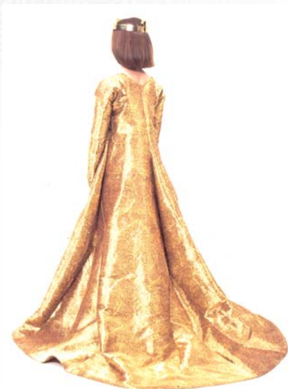
Rekonstruktion af Margrethe 1.'s gyldne kjole